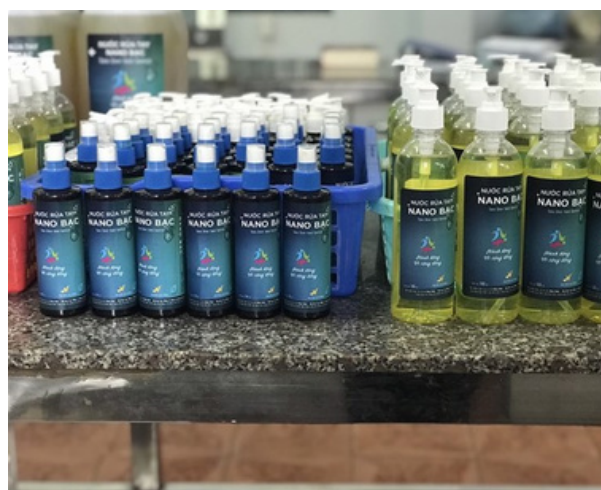
Hình 9. Sát khuẩn Nano bạc do tập thể cán bộ giảng viên, sinh viên khoa Dược Trường Đại học Lạc Hồng nghiên cứu, phát triển.

Sản phẩm dung dịch rửa tay sát khuẩn Nano Bạc này không chỉ đáp ứng nhu cầu hàng ngày của mọi người về vệ sinh cá nhân mà còn giúp bảo vệ sức khỏe, ngăn ngừa bệnh tật và tạo cơ hội để cộng đồng làm việc cùng nhau trong một tinh thần chung. Đây là một ví dụ rõ ràng về cách Đại học Lạc Hồng tham gia vào việc đảm bảo mục tiêu SDG3 của Liên hợp quốc, thúc đẩy sự phát triển bền vững và nâng cao chất lượng cuộc sống cho tất cả mọi người