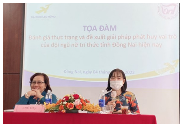
Hình 19. Lãnh đạo cấp cao là nữ giới.

Đại học Lạc Hồng thể hiện sự cam kết đối với SDG5 thông qua nhiều chính sách và hoạt động. Việc có nhiều lãnh đạo nữ giới trong cơ cấu quản lý của trường không chỉ thể hiện tính công bằng mà còn tấm gương sáng cho sinh viên noi theo. Điều này thúc đẩy sự đa dạng và khuyến khích phát triển sự nghiệp dựa trên năng lực, thay vì phân biệt giới tính.