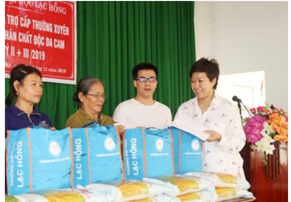
Hình 6. Tặng quà cho hộ gia đình khó khăn.

Ngoài quỹ nhân ái, trong năm vừa qua Ban lãnh đạo Trường Đại học Lạc Hồng và Trường Song ngữ Lạc Hồng phát động “Chiến dịch chia sẻ yêu thương”, nhằm quyên góp và hỗ trợ các phần quà cho cá nhân, hộ gia đình có hoàn cảnh khó khăn, người già neo đơn, công nhân mất việc ... do ảnh hưởng của đại dịch Covid-19.