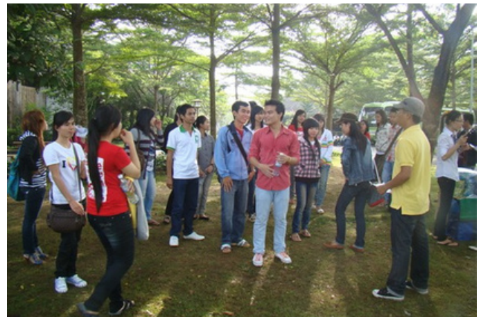
Hình 30. Giao lưu văn hoá Việt Lào

Hoạt động giao lưu văn hóa giữa hai nước mang lại nhiều ý nghĩa quan trọng, tạo cầu nối giữa hai quốc gia, thúc đẩy sự hiểu biết và tôn trọng đa dạng văn hóa. Nhờ đó, những giá trị văn hóa đặc trưng của Việt Nam và Lào được chia sẻ và lan tỏa, góp phần xây dựng một thế giới đa văn hóa và công bằng.