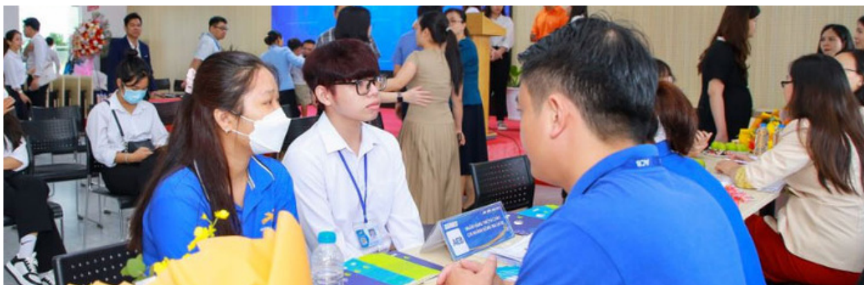
Hình 22. Trong một số trường hợp đặc biệt, căn cứ vào yêu cầu của đợt tuyển dụng và tình hình thực tế

Đại học Lạc Hồng cam kết thực hiện SDG8 không chỉ thông qua chính sách tuyển dụng công bằng và không phân biệt đối xử mà còn qua nhiều hoạt động và chương trình khác nhau nhằm thúc đẩy sự phát triển bền vững.