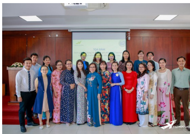
Hình 18. Các buổi toạ đàm về phụ nữ tri thức tổ chức tại Trường.

Bình đẳng giới, một trong những nguyên tắc quan trọng của Mục tiêu Phát triển Bền vững số 5 (SDG5) của Liên Hợp Quốc, đóng một vai trò quan trọng trong việc xây dựng một xã hội công bằng và phát triển bền vững. Đây không chỉ là một vấn đề về quyền lợi và cơ hội của phụ nữ mà còn về quyền lợi và cơ hội của tất cả mọi người, bất kể giới tính.