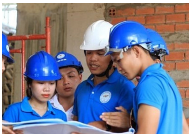
Hình 21. Sinh viên nữ ngành kỹ thuật công trình

Chính sách trả lương bình đẳng dựa trên năng lực tại Đại học Lạc Hồng là một ví dụ về cam kết đối với bình đẳng giới. Tại trường, lương được xác định dựa trên năng lực, trình độ và thành tích công việc thay vì giới tính của người lao động. Điều này tạo ra môi trường công bằng và khuyến khích phụ nữ và nam giới tham gia và phát triển sự nghiệp dựa trên khả năng và đóng góp thay vì bị giới tính hạn chế.