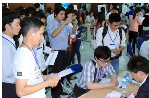
Hình 24. Tuyển dụng sinh viên tại ngày hội việc làm

Cơ hội cho sinh viên: Ngày hội việc làm cung cấp cơ hội quý báu cho sinh viên Đại học Lạc Hồng tìm hiểu về các cơ hội nghề nghiệp, xây dựng mối quan hệ với doanh nghiệp và tổ chức tìm việc làm tốt cho tương lai. Điều này thúc đẩy SDG8 bằng cách đảm bảo rằng họ có cơ hội tiếp cận thị trường lao động và phát triển sự nghiệp.