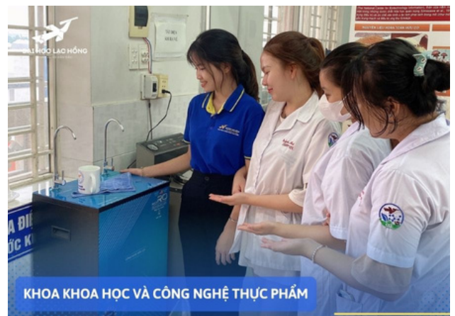
Hình 8. Máy lọc nước uống triển khai tại Đại học Lạc Hồng

Đại học Lạc Hồng cam kết hỗ trợ mục tiêu phát triển bền vững của Liên Hợp Quốc, đặc biệt là SDG3, thông qua nhiều hoạt động cộng đồng hữu ích. Một số hoạt động mà trường đã triển khai để gắn liền với mục tiêu bao gồm hoạt động hiến máu nhân đạo, nước sạch và chuyển giao các sản phẩm chăm sóc sức khỏe đến cộng đồng.