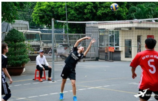
Hình 31. Sân giáo dục thể chất Trường Đại học Lạc Hồng.

Tạo sân chơi cho sinh viên học tập và rèn luyện, sinh hoạt cộng đồng là một ví dụ điển hình cho việc thực hiện cam kết SDG11 của Trường Đại học Lạc Hồng. Không gian rộng rãi và các thiết bị hiện đại để sinh viên có thể thực hành các môn thể thao và rèn luyện sức khỏe. Điều này không chỉ giúp cải thiện sức khỏe và thể lực của sinh viên, mà còn tạo điều kiện tốt để họ phát triển các kỹ năng xã hội, tăng cường sự tự tin và rèn luyện tinh thần đồng đội.