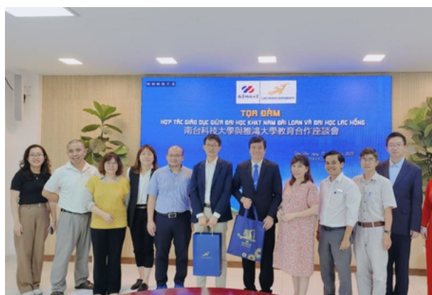
Hình 36. Các đại diện của STUST và Đại học Lạc Hồng

Hợp tác giữa hai trường tạo ra cơ hội học tập và trao đổi kinh nghiệm giữa các nhà nghiên cứu và chuyên gia từ hai bên. Việc chia sẻ kiến thức và kỹ thuật giúp mở rộng tầm nhìn và nâng cao năng lực nghiên cứu của trường Đại học Lạc Hồng, từ đó đóng góp vào việc giải quyết các vấn đề kỹ thuật và phát triển bền vững trong cả hai quốc gia.