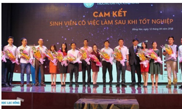
Hình 23. Hợp tác với doanh nghiệp để đảm bảo việc làm cho sinh viên

Việc thường xuyên tổ chức ngày hội việc làm tại Đại học Lạc Hồng đóng góp quan trọng vào việc thực hiện Mục tiêu Phát triển Bền vững số 8 (SDG8) của Liên Hợp Quốc, mục tiêu này thúc đẩy góp phần tạo cơ hội việc làm cho sinh viên trong trường. Những sự kiện này không chỉ mang lại lợi ích cho sinh viên trường học mà còn cho cả cộng đồng ngoài trường tham gia.