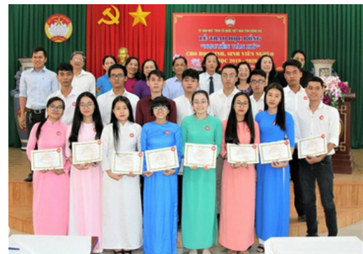
Hình 1. Trao học bổng cho sinh viên