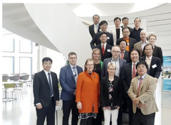
Hình 37. Thành viên của các trường tham gia dự án EMVITET

Dự án EMVITET đã tập trung vào việc cải thiện quản lý và phát triển kinh doanh trong các cơ sở giáo dục đại học tại Việt Nam, với mục tiêu hỗ trợ quá trình đổi mới và nâng cao chất lượng giáo dục đại học. EMVITET đã giúp xây dựng mối quan hệ đối tác mạnh mẽ giữa Đại học Lạc Hồng và các trường đại học tổ chức giáo dục Việt Nam. Điều này có ý nghĩa quan trọng trong việc thúc đẩy hợp tác và đổi mới trong lĩnh vực giáo dục.