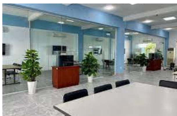
Hình 17. Thư viện Trường Đại học Lạc Hồng

Không chỉ truy cập vào các công trình nghiên cứu thông qua tạp chí Lạc Hồng, ngoài ra còn có thư viện số với đầy đủ thông tin tài liệu hiện đại để hỗ trợ quá trình học tập và nghiên cứu học thuật. Thư viện số đóng vai trò quan trọng trong việc đáp ứng nhu cầu tra cứu thông tin của sinh viên, giảng viên và những người quan tâm đến kiến thức và nghiên cứu. Thư viện số không chỉ là một nguồn kiến thức quý báu mà còn tạo điều kiện thuận lợi cho việc học tập và nghiên cứu đa dạng, thúc đẩy sự sáng tạo và đóng góp vào mục tiêu SDG4 bằng cách đảm bảo rằng mọi người có cơ hội tiếp cận và tận dụng giáo dục chất lượng, không bị giới hạn bởi thời gian và không gian.