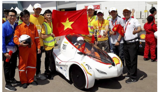
Hình 28. Đội xe LH-EST Đại học Lạc Hồng xuất sắc giành giải vô địch.