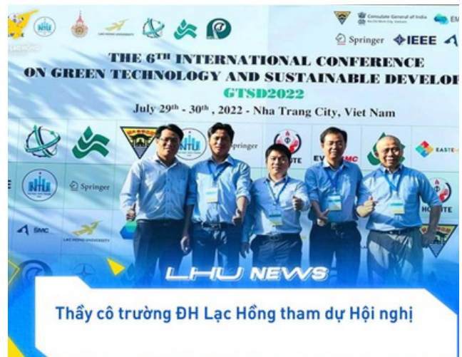
Hình 38. Giảng viên Trường Đại học Lạc Hồng tham gia hội thảo GTSD

Tham gia Hội thảo Khoa học quốc tế "Công nghệ xanh và Phát triển bền vững lần thứ 6", Trường Đại học Lạc Hồng đẩy mạnh giao lưu, hợp tác và phát triển khoa học công nghệ trong và ngoài nước, đặc biệt lĩnh vực Công nghệ xanh và Phát triển bền vững.