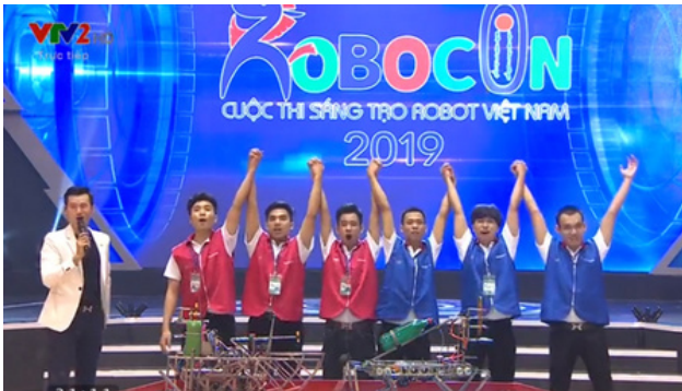
Hình 27. Đội Robocon Đại học Lạc Hồng

Trong những năm vừa qua Đại học Lạc Hồng đóng vai trò quan trọng trong việc thúc đẩy phát triển bền vững thông qua các cuộc thi và chương trình đổi mới sáng tạo. Các sự kiện như cuộc thi về thiết kế xe tiết kiệm nhiên liệu và cuộc thi Robocon không chỉ thúc đẩy tinh thần sáng tạo và khám phá mà còn mang lại nhiều lợi ích quan trọng như khám phá và phát triển kỹ năng và giải pháp sáng tạo cho các thách thức.