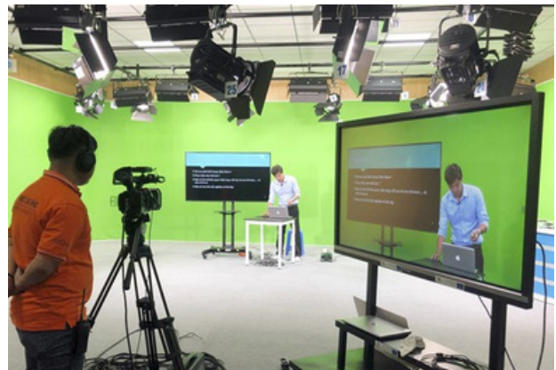
Hình 26. Hỗ trợ giảng viên ghi hình bài giảng trực tuyến

Hệ thống E-learning cung cấp cho giảng viên khả năng đánh giá kết quả học tập của người học ngay trên nền tảng học tập. Giảng viên có thể theo dõi tiến độ học tập, đánh giá bài tập và cung cấp phản hồi nhanh chóng. Điều này giúp tăng tính tương tác và phản hồi hiệu quả, giúp người học cải thiện kỹ năng và kết quả học tập đóng góp vào việc thực hiện cam kết SDG9 bằng cách tạo ra môi trường học tập gắn với thực tế.