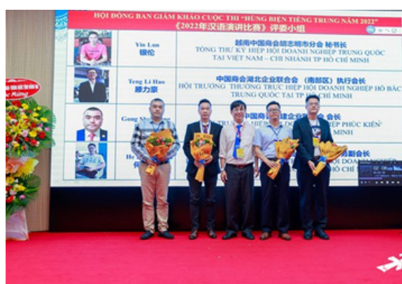
Hình 16. Thầy Hiệu trưởng tặng hoa cho Ban giám khảo cuộc thi

Cuộc thi hùng biện ngôn ngữ khuyến khích học sinh và sinh viên nâng cao khả năng giao tiếp, tư duy logic và nghiên cứu, tất cả đều là kỹ năng quan trọng trong quá trình học tập và trong cuộc sống hàng ngày. Bằng cách tham gia vào cuộc thi này, sinh viên có cơ hội thảo luận về những vấn đề quan trọng như giáo dục, sự bình đẳng, và phát triển bền vững, giúp họ hiểu sâu hơn về các mục tiêu của SDG 4.