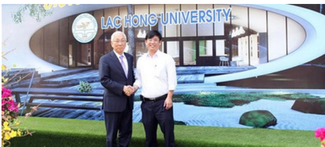
Hình 2. Đại diện Quỹ học bổng Mabuchi tại Đại học Lạc Hồng

Hàng năm, Trường Đại Học Lạc Hồng dành hơn 3 tỷ đồng cho các học bổng dành cho sinh viên khó khăn (Học bổng Mabuchi, Học bổng Sacombank...). Điều này có ý nghĩa quan trọng trong việc hỗ trợ người học hoàn thành chương trình học.