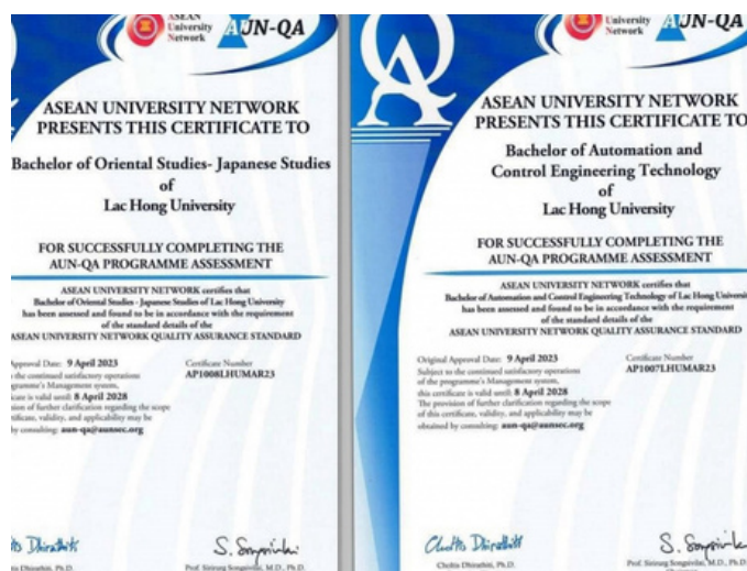
Hình 12. Chứng nhận Đạt chuẩn kiểm định chất lượng AUN - QA

Ngoài ra, các dự án phát triển giáo dục như EMVITET và BUILD IT không chỉ nâng cao trình độ của giảng viên mà còn giúp Đại học Lạc Hồng áp dụng các phương pháp giảng dạy hiện đại và hiệu quả hơn trong việc truyền đạt kiến thức cho sinh viên. Việc chia sẻ kiến thức về giáo dục với các trường địa phương là một cách tuyệt vời để góp phần nâng cao chất lượng giáo dục ở cấp địa phương, tạo ra môi trường học tập tốt hơn cho tất cả mọi người.