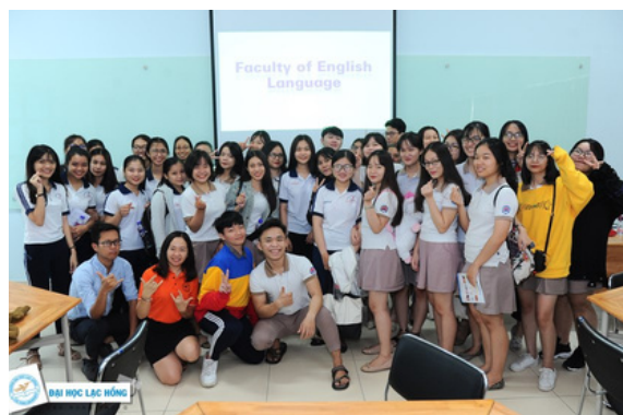
Hình 32. Học sinh trải nghiệm tại Trường Đại học Lạc Hồng

Sân giáo dục thể chất không chỉ đơn thuần là một nơi dành riêng cho sinh viên học tập, mà còn là một không gian mở cho người dân địa phương tham gia vào các hoạt động thể thao và giải trí, giúp cải thiện chất lượng cuộc sống của người dân tạo ra một môi trường sống thân thiện.