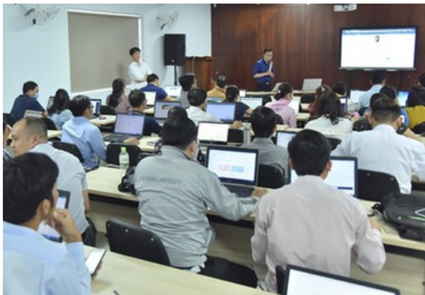
Hình 25. Giảng viên tập huấn phương thức dạy trực tuyến

Chuyển đổi số trong giáo dục: Bằng cách tích hợp công nghệ số trong quá trình giảng dạy và học tập, Đại học Lạc Hồng đã tạo ra một môi trường học tập hiện đại, giúp phát triển các kỹ năng sống cần thiết và nâng cao năng lực số cho sinh viên trong bối cảnh ngày càng số hóa của thế giới.