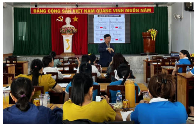
Hình 4. Đại học Lạc Hồng tập huấn khởi nghiệp cho phụ nữ tỉnh Đồng Nai

Tập huấn khởi nghiệp cho phụ nữ của Trường Đại Học Lạc Hồng có ý nghĩa quan trọng. Nó khuyến khích phụ nữ tham gia khởi nghiệp, xóa bỏ rào cản giới tính và tạo cơ hội kinh doanh. Tập huấn này góp phần vào sự phát triển kinh tế và xây dựng mạng lưới hỗ trợ cho phụ nữ khởi nghiệp.