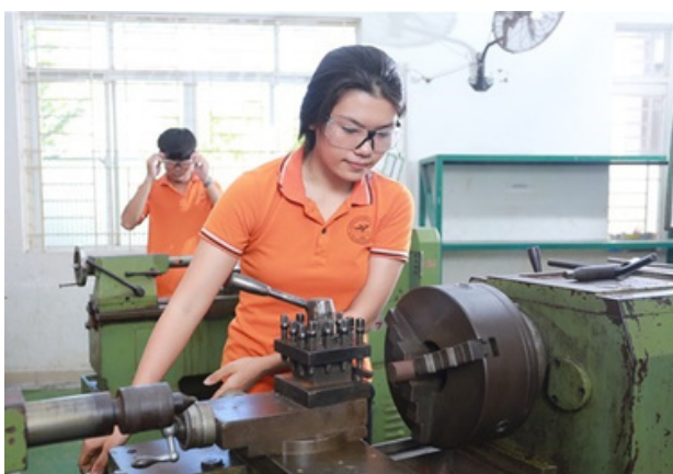
Hình 20. Sinh viên nữ ngành Cơ điện tử

Chính sách học bổng cho sinh viên nữ học khối STEM là một ví dụ khác về cách Đại học Lạc Hồng thúc đẩy bình đẳng giới. Điều này khuyến khích phụ nữ tham gia vào các lĩnh vực công nghệ và khoa học, nơi họ có thể đóng góp nhiều ý tưởng sáng tạo và sự đổi mới. Bằng cách tạo điều kiện cho sự phát triển bền vững của phụ nữ đóng góp vào mục tiêu SDG5 và giúp xây dựng một xã hội công bằng và đa dạng hơn.