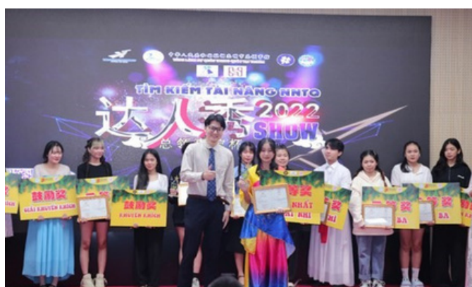
Hình 15. Tiết mục tài năng của thí sinh tham gia cuộc thi Hùng biện tiếng Trung

Cuộc thi hùng biện ngôn ngữ không chỉ là một cơ hội cho sinh viên thể hiện tài năng trong việc diễn đạt ý kiến, mà còn mang theo một ý nghĩa sâu sắc liên quan đến Mục tiêu Phát triển Bền vững số 4 (SDG 4) của Liên Hợp Quốc, mục tiêu này hướng đến đảm bảo mọi người có cơ hội tiếp cận và hoàn thành giáo dục chất lượng.