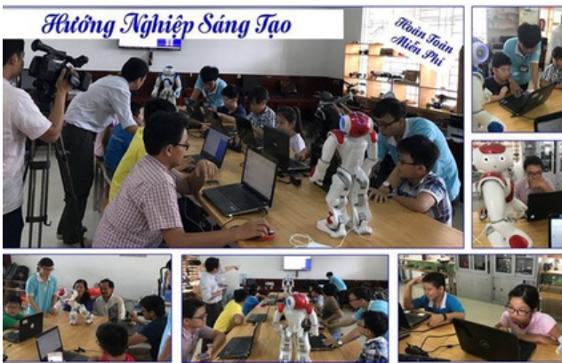
Hình 13. Các bé say mê khám phá

Các lớp tập huấn về robot cho học sinh của Đại học Lạc Hồng không chỉ đơn giản là một cơ hội học hỏi về công nghệ và lập trình mà còn truyền tải một thông điệp quan trọng về giáo dục. Chúng là minh chứng sống rằng giáo dục không giới hạn bởi tuổi tác, giới tính hoặc nền tảng xã hội. Điều quan trọng là mọi người đều có cơ hội học hỏi và phát triển.