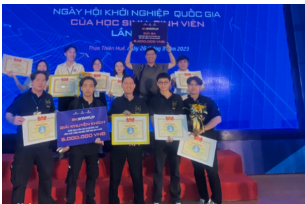
Hình 3. Sinh viên Đại học Lạc Hồng đạt giải khởi nghiệp Quốc gia

Trường Đại Học Lạc Hồng trong năm vừa qua tham gia hỗ trợ cộng đồng một số dự án khởi nghiệp tại tỉnh Đồng Nai và Thừa Thiên Huế ( https://lhu.edu.vn/118/42854/QTKTQT-Hai-du-an-khoi-nghiep-cua-sinh-vien-LHU-dat-thanh-tich-cao-tai-SV-Startup-2023.html ). Trường tổ chức tập huấn chuyên đề phụ nữ khởi nghiệp nhằm cung cấp kiến thức, kỹ năng và cơ hội để nâng cao khả năng khởi nghiệp của phụ nữ tại Đồng Nai. Điều này góp phần vào chính sách giảm nghèo của tỉnh Đồng Nai.