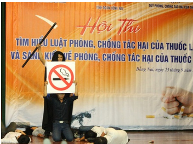
Hình 10. Phần dự thi của Trường Đại học Lạc Hồng

Trường Đại Học Lạc Hồng đã triển khai nhiều hoạt động nhằm nâng cao nhận thức của đội ngũ cán bộ, đoàn viên và thanh niên về tác hại của thuốc lá ( https://lhu.edu.vn/117/28992/DH-Lac-Hong-dat-Giai-Nhat-Cuoc-thi-tim-hieu-Luat-va-sang-kien-phong-chong-tac-hai-thuoc-la.html )