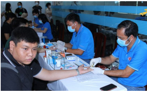
Hình 7. Sinh viên Đại học Lạc Hồng hiến máu nhân đạo