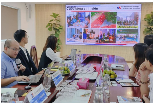
Hình 35. Hình ảnh làm việc chung giữa hai trường

https://hoptac.lhu.edu.vn/386/42812/Toa-dam-hop-tac-giao-duc-giua-Dai-hoc-KHKT-Nam-Dai-Loan-va-Dai-hoc-Lac-Hong.html