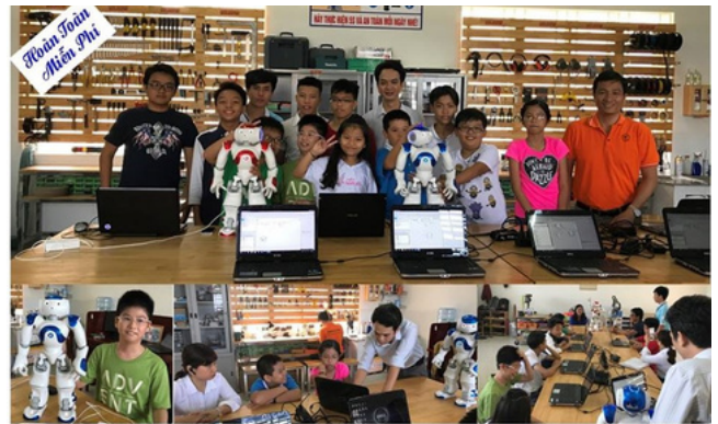
Khai Giảng Lớp Lập Trình Robot NAO