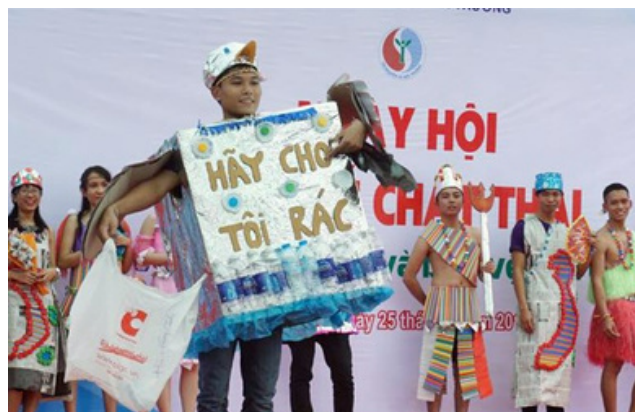
Hình 34. Bộ sưu tập với chủ đề “Tái chế - Tiết kiệm và bảo vệ môi trường”

Đại học Lạc Hồng đóng góp vào mục tiêu này bằng cách thực hiện các hoạt động tái chế và tiết kiệm tài nguyên. Việc tạo ra chương trình tái chế và quản lý chất thải hiệu quả trong khuôn viên trường học giúp giảm lượng rác thải và ô nhiễm môi trường.