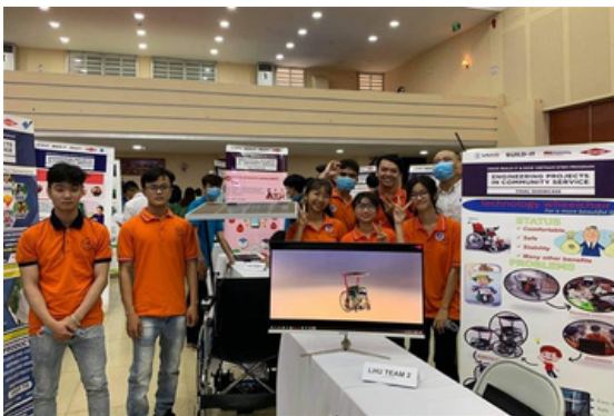
Hình 29. Dự án Xe lăn điện của đã giành Giải Nhất tại Cuộc thi EPIC

Đại học Lạc Hồng đã thực hiện cam kết SDG10 của Liên Hiệp Quốc thông qua các hoạt động giải quyết những bất bình đẳng trong xã hội, đặc biệt là thông qua dự án xe lăn điện nhằm hỗ trợ người khuyết tật và phục vụ cộng đồng. Xe lăn điện không chỉ giúp người khuyết tật di chuyển dễ dàng và độc lập hơn, mà còn mang lại sự tự tin và sự tham gia tích cực trong các hoạt động xã hội.